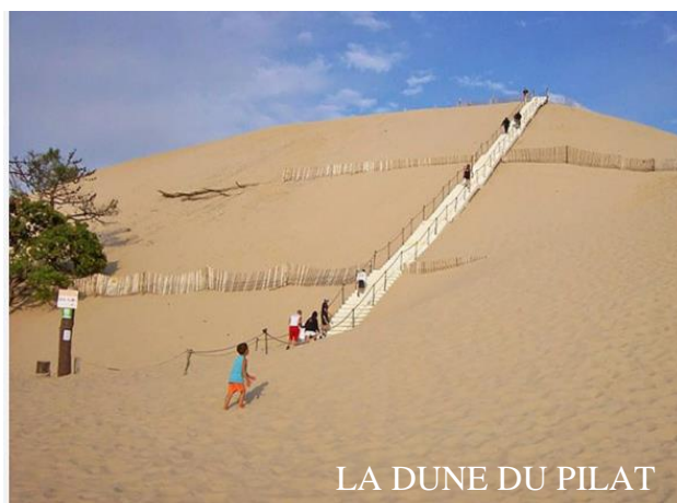
LA DUNE DU PILAT